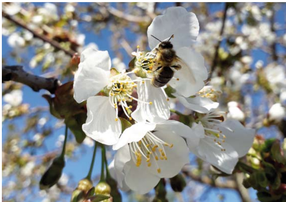
Fot. 3. Pszczoły pełnią niezastąpioną rolę zapylaczy wielu gatunków roślin, w tym także tych uprawianych przez człowieka, takich jak rzepak czy rośliny sadownicze