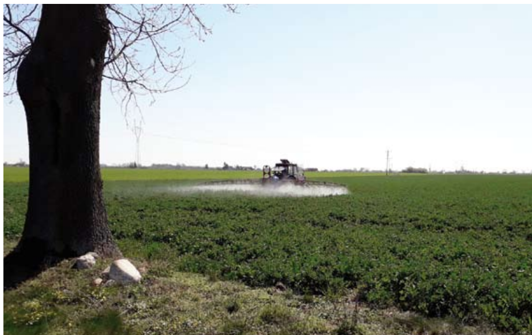
Fot. 8. Pestycydy wpływają negatywnie na zdrowie i zachowanie dorosłych pszczół