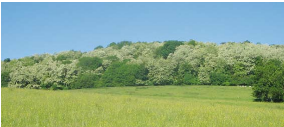
Fot. 1. Żerowanie pszczół w kwiatach akacji jest silnie zależne od klimatu; opady deszczu występujące w okresie kwitnienia akacji mogą zmniejszyć zbiory nektaru