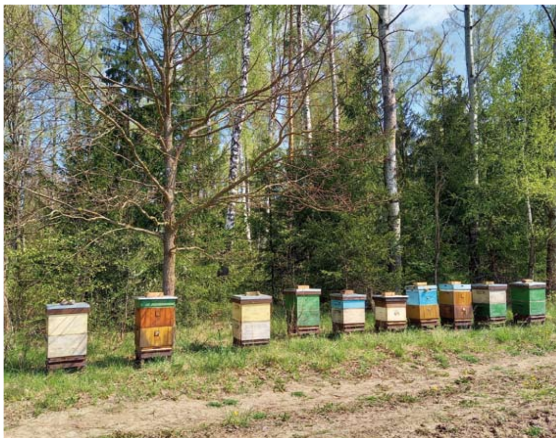
Fot. 6. Pszczoły są nieocenione w lasach, gdzie ich obecność zwiększa liczbę owoców leśnych, co z kolei poprawia warunki bytowania dzikiej zwierzyny

Z dostępnych wyników badań wynika, że aż 3 na 4 gatunki roślin rosnących w strefie klimatu umiarkowanego, to rośliny zapylane przez zwierzęta. W kontekście ekosystemowym, zapylanie zapewnia obfitość różnorodnych owoców i nasion, co z kolei przyczynia się do powszechnego występowania wysokiej jakości pożywienia dla zwierząt. Efekty zapylania kwiatów mają także bezpośredni wpływ na człowieka, który od początków istnienia uzależniony jest od roślin jako źródła pokarmu, lekarstw, a także materiałów wykorzystywanych w codziennym życiu. W aspekcie ekonomicznym, pełne zapylenie roślin ma kluczowe znaczenie dla rolników, sadowników i wszystkich osób zajmujących się uprawą roślin. Warto pamiętać, że pszczoły miodne ze względu na specyfikę aparatu gębowego i budowę kwiatu, słabo zapylają niektóre uprawy (np. lucernę, pomidory, paprykę). Pszczół miodnych nie można także skutecznie wykorzystywać w uprawach szklarniowych. Do zapylania takich upraw wykorzystuje się trzmiele i niektóre pszczoły.