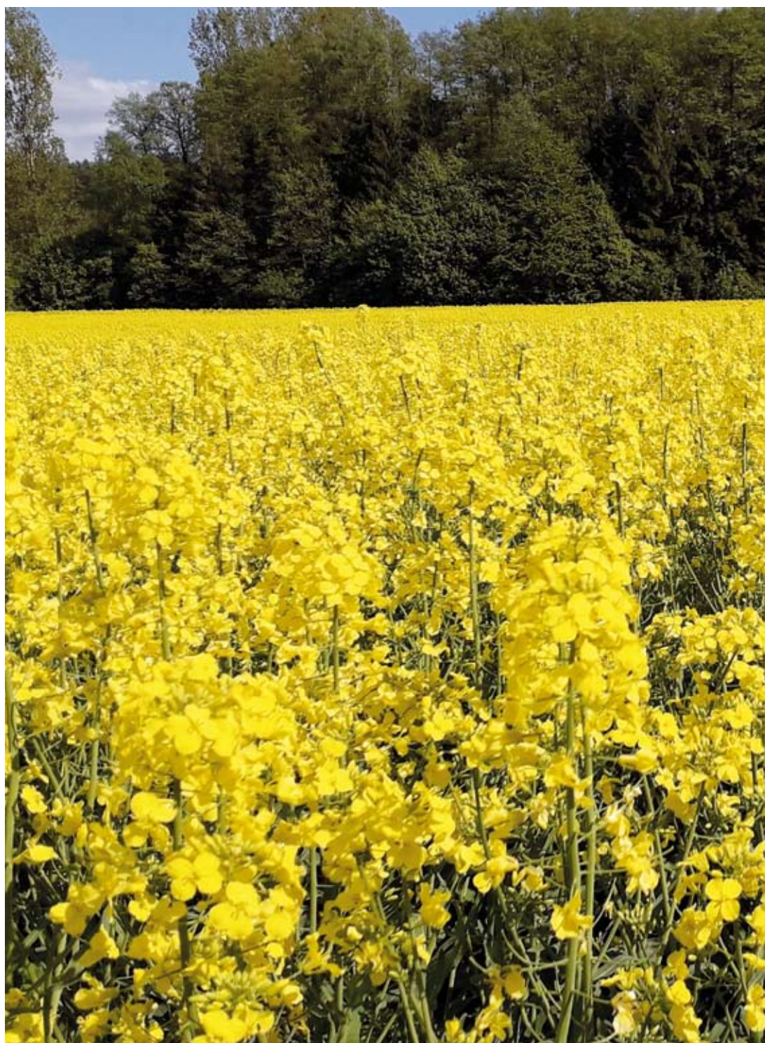
Fot. 4. Rzepak jest pożytkiem towarowym; jego kwiaty dostarczają duże ilości nektaru, ale przez krótki czas