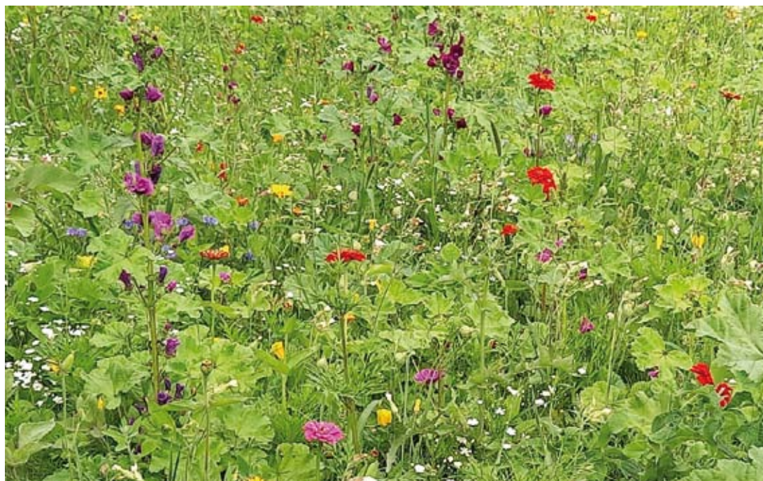
Fot. 9. Miejska łąka kwitna

stwa. Konstrukcja gniazd jest zróżnicowana – mogą one być budowane z ziemi, żywicy, wosku lub roślinności, w zależności od gatunku pszczoły i jej strategii życiowej. Pszczoły wymagają odpowiednich warunków do budowy swoich gniazd. Gniazda ziemne muszą znajdować się w gruncie o odpowiedniej spójności, umożliwiającej wykopanie tuneli i komór lęgowych, które nie będą się zapadały. Gniazda naziemne muszą być wykonane z odpowiednich materiałów, takich jak próchniejące drewno czy rośliny, w których można drążyć tunele. Ponadto, pszczoły często korzystają z już istniejących nor, opuszczonych przez gryzonie lub inne owady, pustych muszli ślimaków czy szczelin w skałach lub murach. Gniazda muszą być umiejscowione w odpowiednich warunkach, w których panują optymalne temperatura i wilgotność, dlatego pszczoły preferują miejsca ciepłe, suche, chronione przed wiatrem i zalaniem wodą.