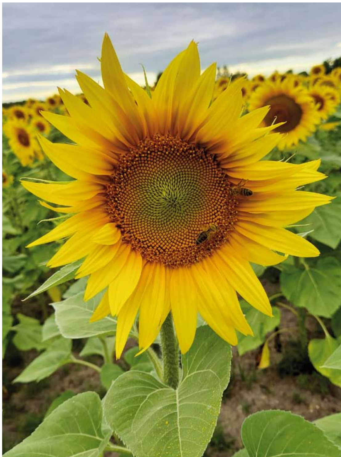
Fot. 5. Plantacje słoneczników zapylane przez pszczoły