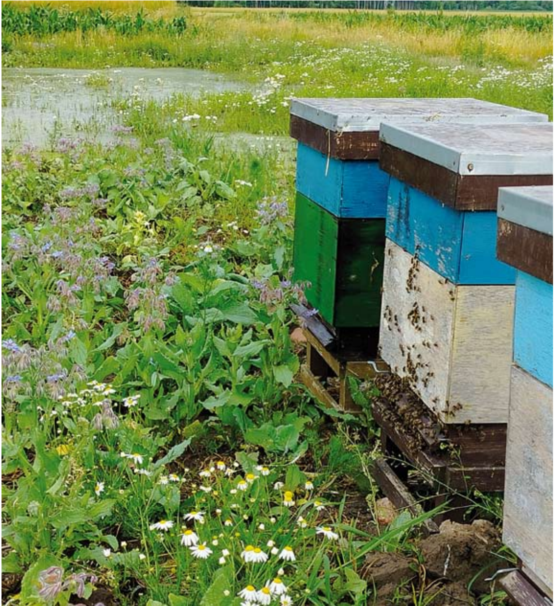
Fot. 7. Prowadzenie pasieki wędrownej wpływa na zapylanie roślin w różnych ekosystemach i jednocześnie zapewnienie pokarmu zapylaczom

Dzięki pracy owadów zapylających producenci uzyskują wysokie plony roślin o odpowiedniej jakości, np. jabłek czy truskawek, a konsumenci otrzymują szeroką ofertę owoców i warzyw w przystępnych cenach. Bez zapylaczy, produkcja rolna w wielu przypadkach mogłaby stać się niemożliwa i nieopłacalna, co miałyby poważne konsekwencje dla całego łańcucha dostaw żywności.