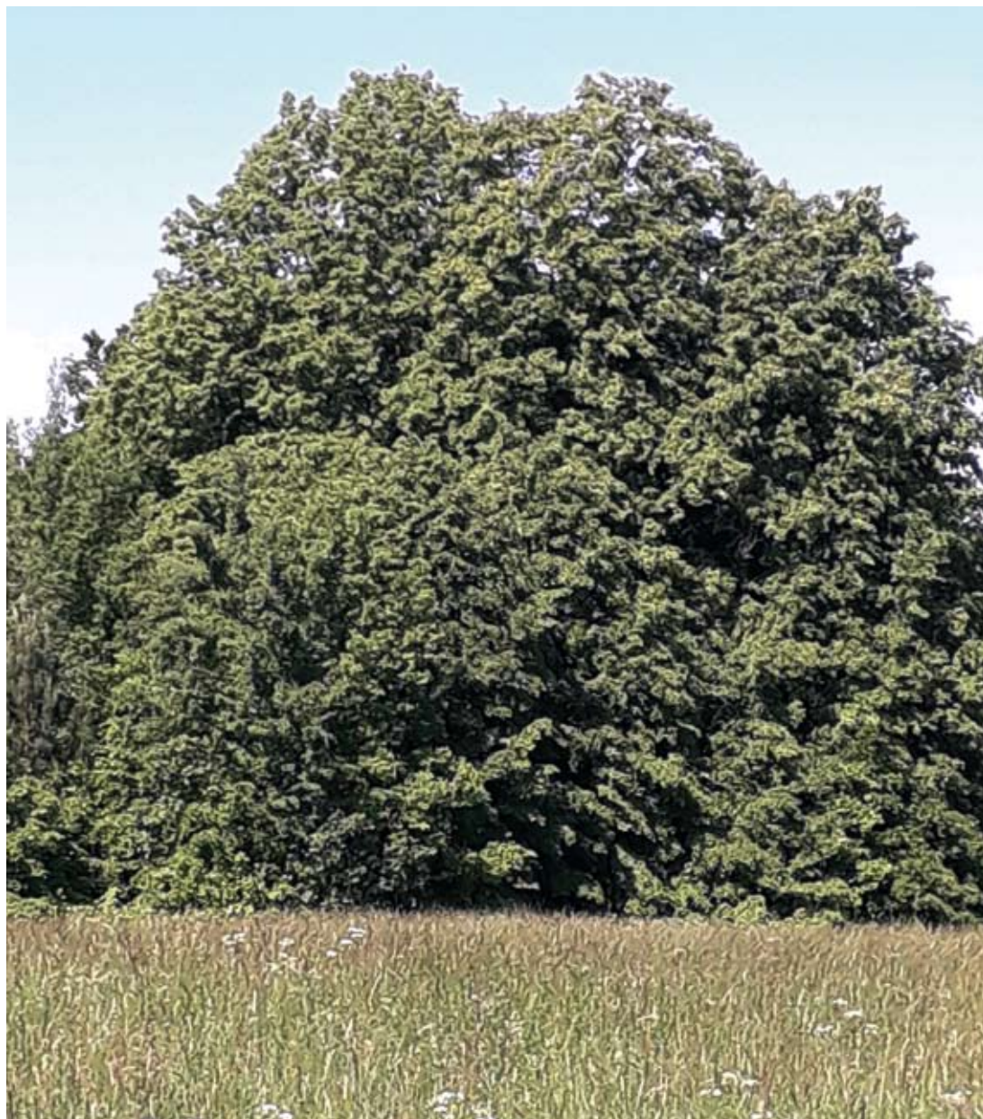
Fot. 2. Zbiór miodu lipowego jest nieprzewidywalny; susza często ogranicza produkcję nektaru przez kwiaty lipy

Pszczelarstwo jest jednym ze sposobów wykorzystania środowiska naturalnego przez człowieka, obejmującym użytkowanie pszczół w celu uzyskania korzyści. Mowa także o zyskach pośrednich wynikających z środowiskotwórczej roli pszczoły, jako zapylacza roślin entomofilnych, a zatem organizmów mających wpływ na zachowanie równowagi w środowisku przyrodniczym.