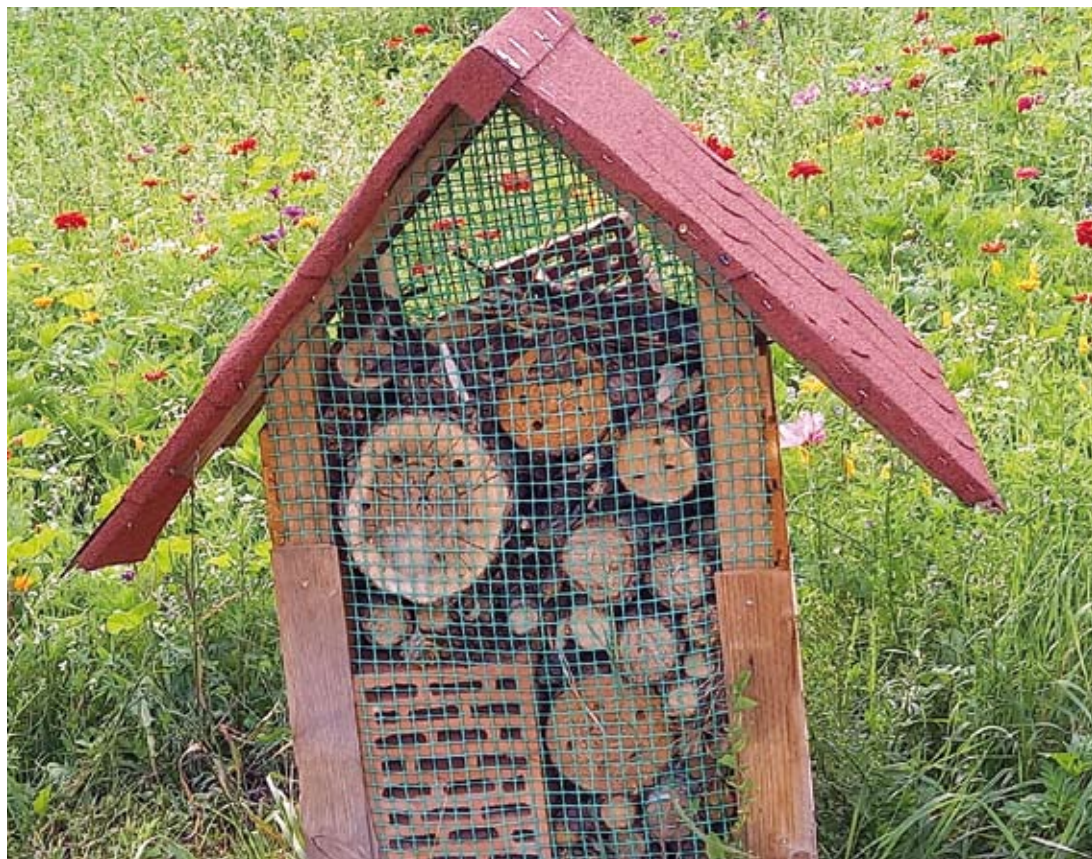
Fot. 10. Hotel dla zapylaczy

Bioróżnorodność pszczół jest niezwykle istotna i powinna być chroniona, ponieważ pszczoły pełnią niezastąpioną rolę zapylaczy wielu gatunków roślin, w tym także tych uprawianych przez człowieka, takich jak rzepak czy rośliny sadownicze. Zachowanie zróżnicowania gatunkowego i liczebności pszczół będzie możliwe dzięki tworzeniu oraz utrzymywaniu półnaturalnych siedlisk, które już istnieją w krajobrazie. Przykładami takich siedlisk są zadrzewienia śródpolne, zakrzaczenia, miedze, przydrożna roślinność, murawy i skarpy, które zapewniają pszczołom odpowiednie miejsca do gniazdowania oraz dostęp do różnorodnego pokarmu przez cały sezon ich rozrodu. Ważnym elementem ochrony pszczół jest także tworzenie korytarzy ekologicznych, czyli pasów zieleni, które łączą poszczególne siedliska. Nie muszą być one duże, ponieważ większość pszczół nie pokonuje długich odległości, ale istotne jest, aby były liczne i zróżnicowane, by spełniać wymagania siedliskowe różnych gatunków pszczół. Tego rodzaju działania